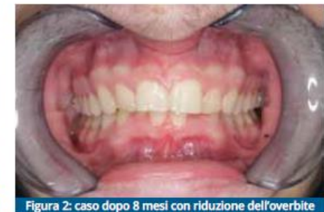
Figura 2: caso dopo 8 mesi con riduzione dell'overbite