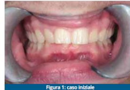
Figura 1: caso iniziale